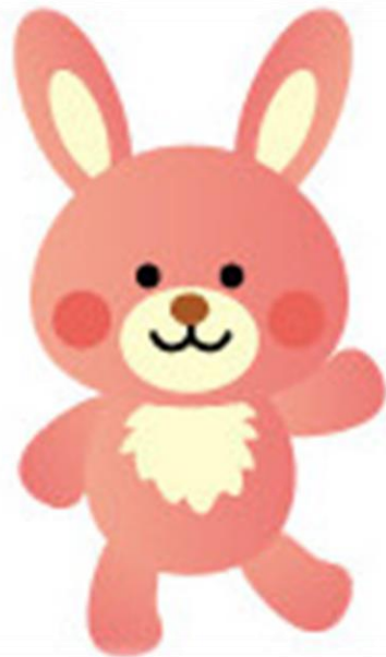
う さ ぎ